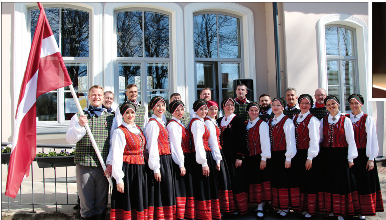
Vidējās paaudzes deju kolektīvs "Duvzare" savās rindās pulcē dejas entuziastus.