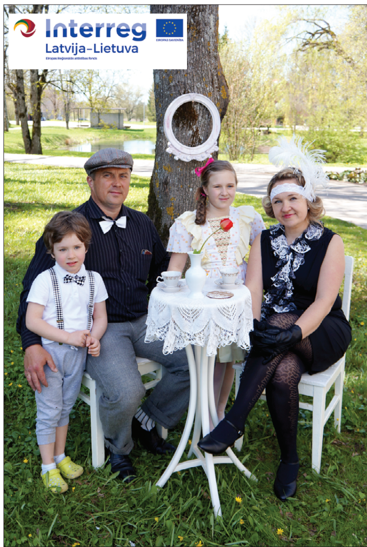
Ločmeļu ģimene braucienam bija saposusies atbilstošos tērpos.